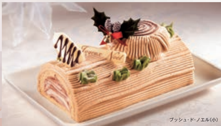
ブッシュ・ド・ノエル(小)