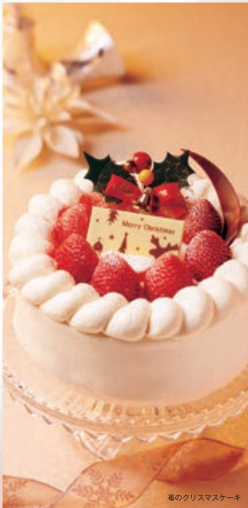
苺のクリスマスケーキ