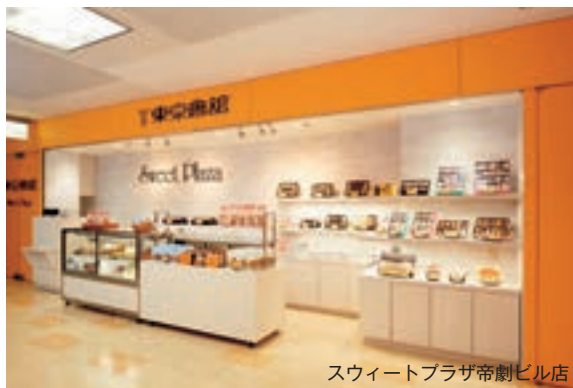
スウィートプラザ帝劇ビル店