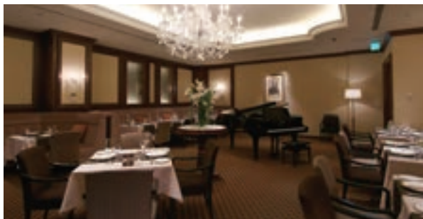
如水会館 ジュピター