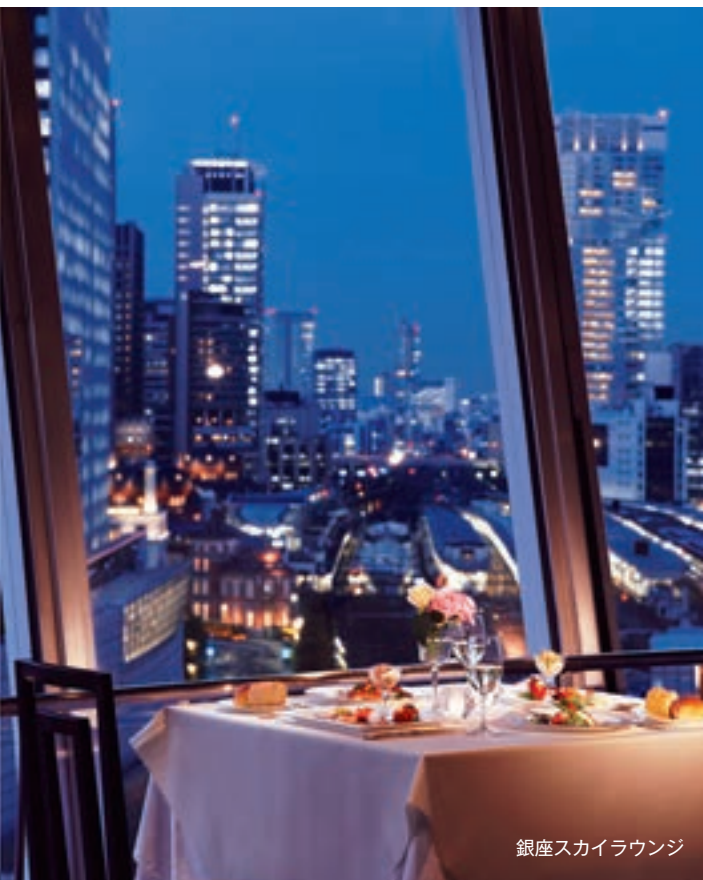
銀座スカイラウンジ

売店・その他の営業につきましては、食品部門で、季節ごとの新商品の販売と、宴会関連のギフト商品の売上獲得および百貨店における催事への出店に積極的に努めました。その結果、売店の売上高は既存営業所比 20.6% の増加となりましたが、クッキングスクールが本館建替えに伴い縮小したことにより、合計では 608 百万円（既存店前期同額）となりました。