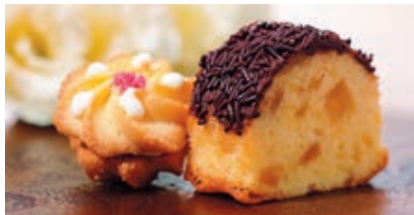
ギフト商品 プティフル（東京會館伝統の銘菓）