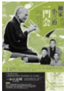
柳家小三治一門会