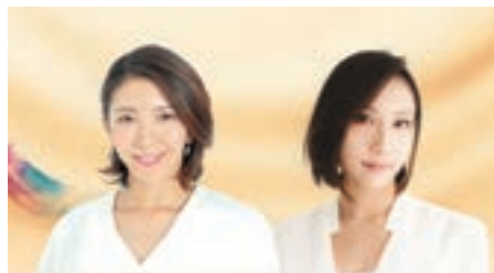
瀬奈じゅん 大空祐飛