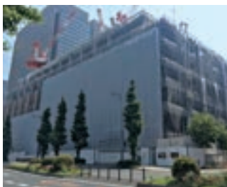
新ビル建設状況（平成29年5月）

平成30年10月の竣工に向けて、昨年12月に立柱式を行い地上階の本格的な建築工事に入り、平成29年5月現在、鉄骨工事は8階9階へ進んでいます。新ビルの建設状況を当社ホームページ“東京會館おもてなしの「今」”でご覧いただけますので、完成までの様子をお楽しみください。