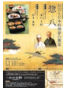
狂言と日本料理 夢の饗宴