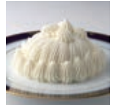
マロンシャンテリー