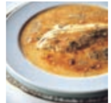
舌平目の洋酒蒸 ボンファム

日本料理「橋畔亭」では、季節を感じる会席料理をはじめ、ランチタイムにはお気軽にご利用いただける、お重、ご膳もご提供しております。全席掘りごたつスタイルで、個室もご用意しておりますので、ご接待やお顔合わせなど大切な会食にもおすすめです。また、「現代の名工」鈴木直登による「日本料理を楽しむ会」ではさまざまなストーリーが含まれた詳細な料理解説も人気です。