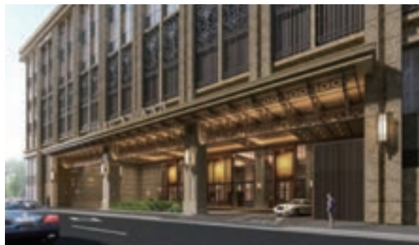
正面玄関（イメージ）