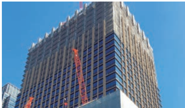
新ビル建設状況(平成29年10月)

平成30年10月の竣工に向けて鉄骨工事は平成29年10月時点で地上30階まで進み、11月には上棟式を執り行い、搭屋部分の鉄骨工事に着手しています。新ビルの建設状況