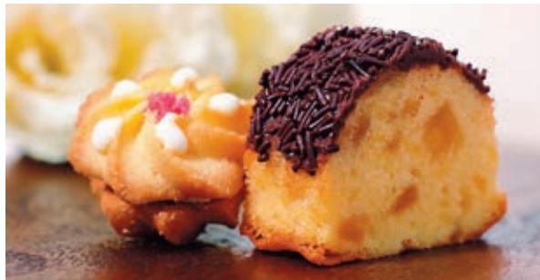
ギフト商品 プティフル（東京會館伝統の銘菓）