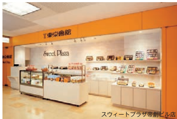
スウィートプラザ帝劇ビル店