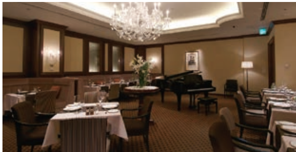
如水会館 ジュピター