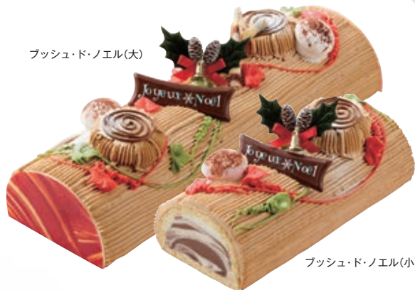
ブッシュ・ド・ノエル(大)