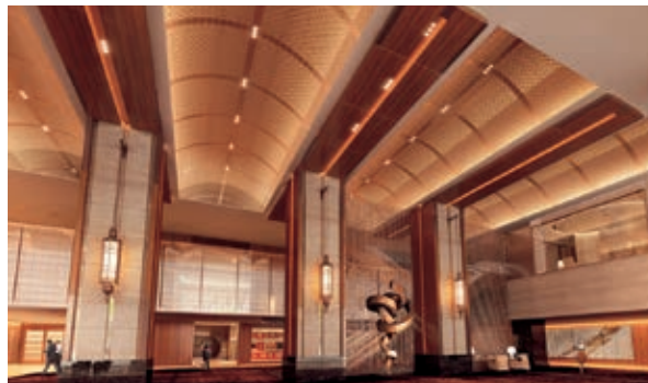
1階ロビー (イメージ)

は、当社ホームページ“東京會館について「本館完成までの歩み」”でご覧いただけますので、引き続き完成までの様子をお楽しみください。