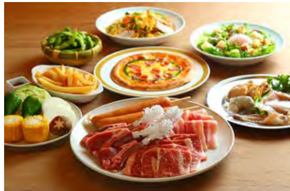
デラックスガーデンプラン(如水会館)