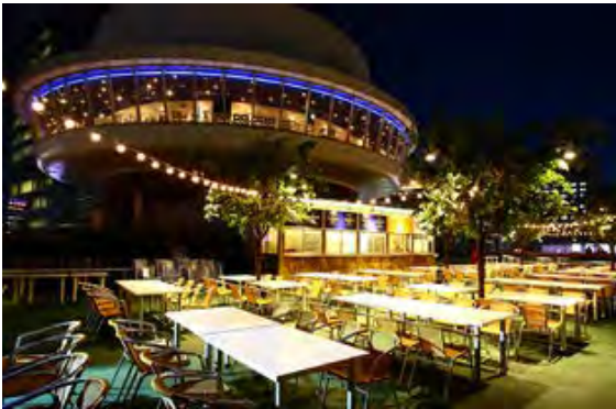
銀座スカイビアテラス