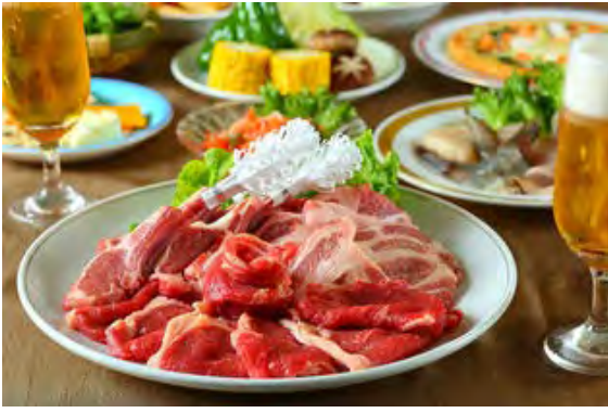
パラダイスガーデンプラン(如水会館)