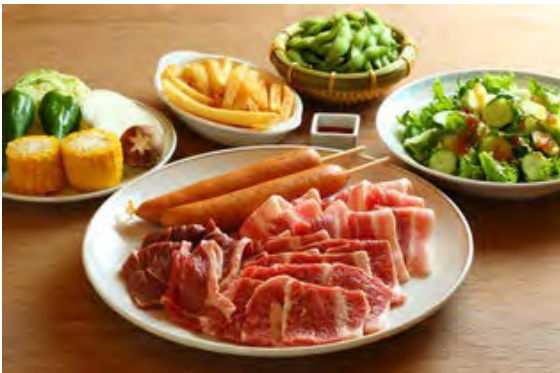
カジュアルガーデンプラン(如水会館)