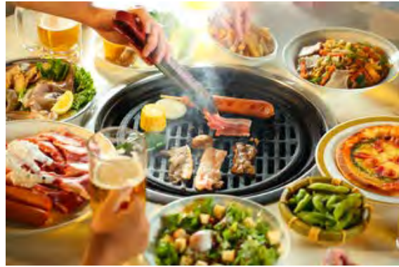
如水ガーデンバーベキュー(如水会館)