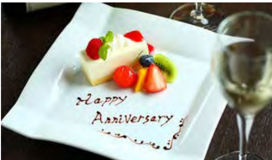
ガーデンバースデープラン(銀座スカイビアテラス)