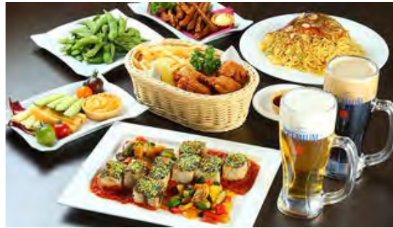
スカイビアプラン(銀座スカイビアテラス)