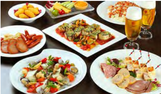
プレミアムプラン(銀座スカイビアテラス)