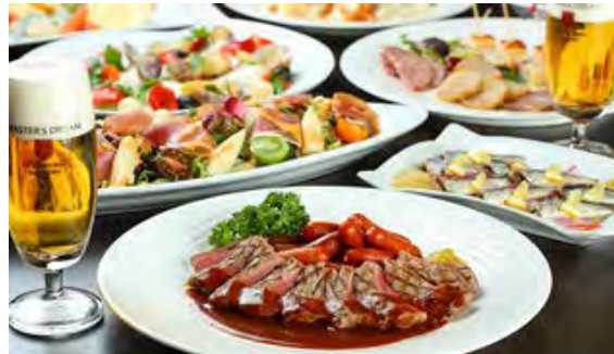
ラグジュアリープラン(銀座スカイビアテラス)