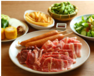
如水会館 ビアガーデン カジュアルガーデンプラン