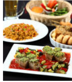
銀座スカイビアテラス スカイビアプラン