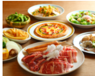
如水会館 ビアガーデン デラックスガーデンプラン