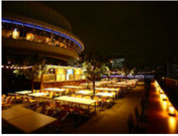
銀座スカイビアテラス