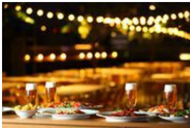
銀座スカイビアテラス