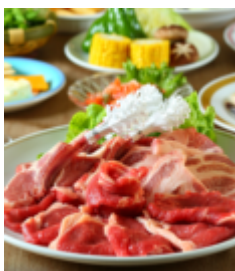
如水会館 ビアガーデン パラダイスガーデンプラン