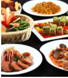
銀座スカイビアテラス プレミアムプラン