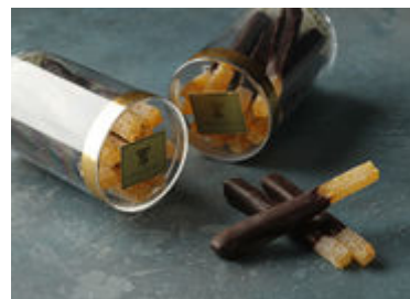
丸ビル限定 オランジェット