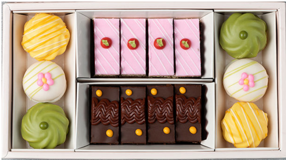
シーズナルプティフル・ラティール(S)