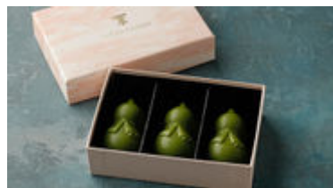
丸ビル限定 ひょうたんショコラ抹茶