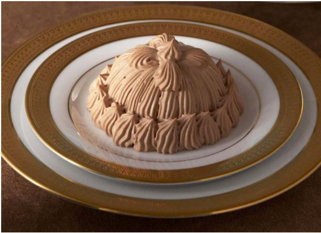
マロンシャンテリーショコラ