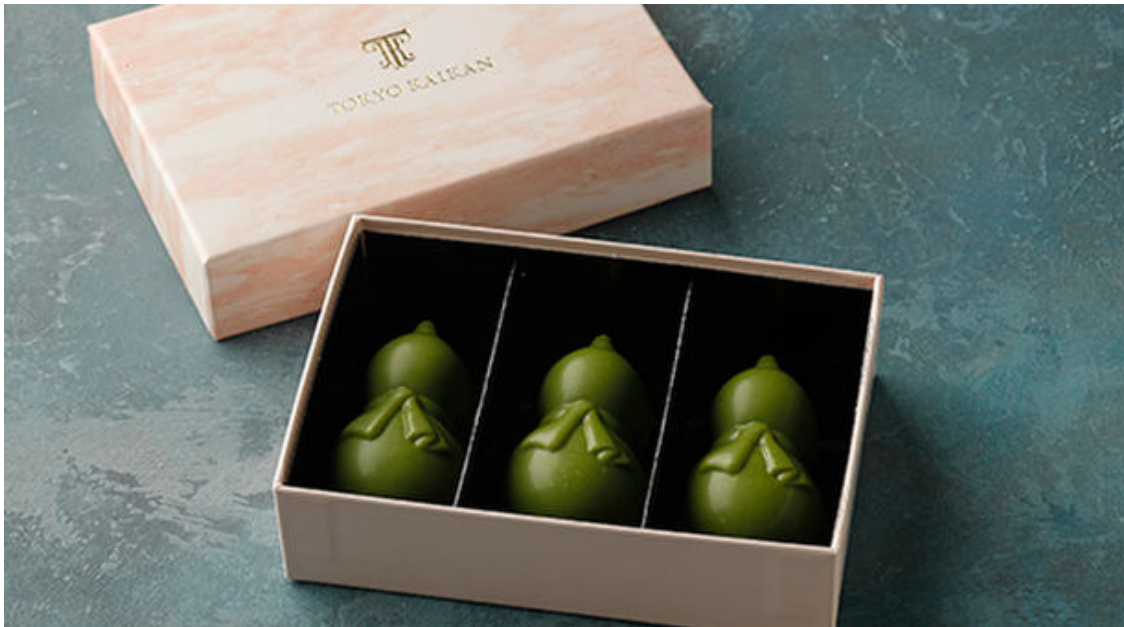
丸ビル限定 ひょうたんショコラ抹茶