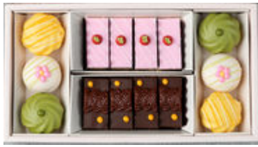
シーズナルプティフル・ラティール(S)