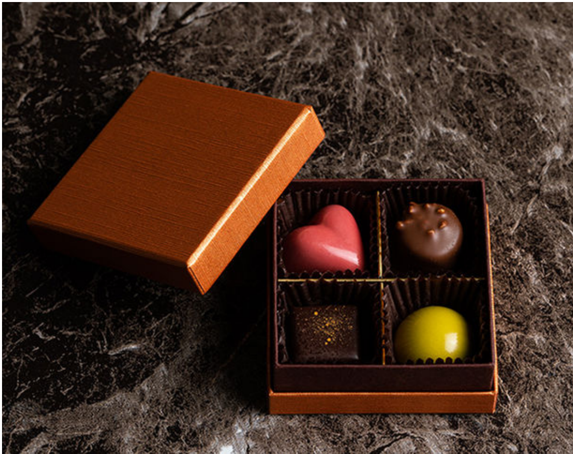
ボンボンアソルティ 4個入り