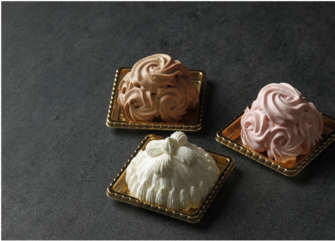
本館限定 ミニマロンシャンテリーセット