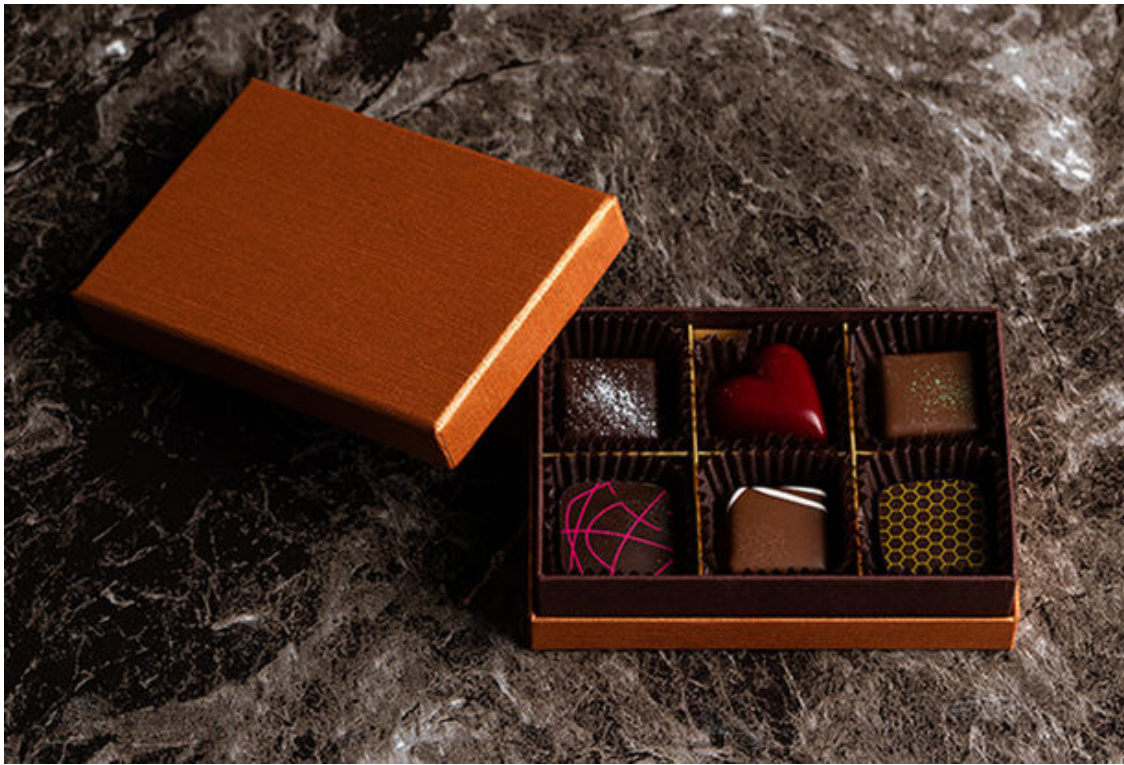
ボンボンアソルティ 6個入り