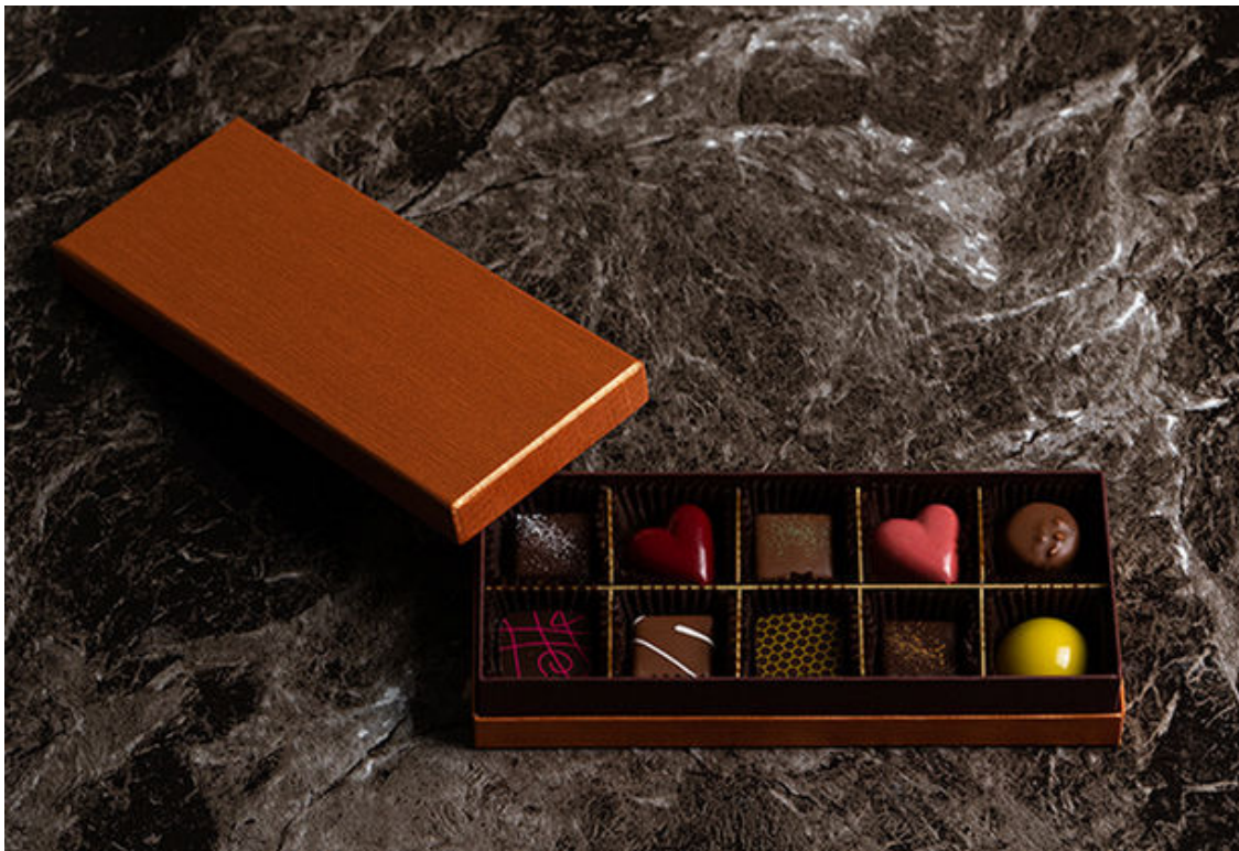
ボンボンアソルティ 10個入り