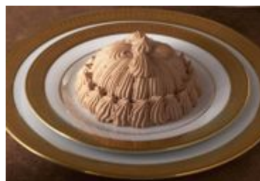
マロンシャンテリーショコラ