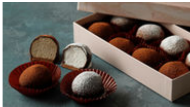
本館限定 生トリュフ