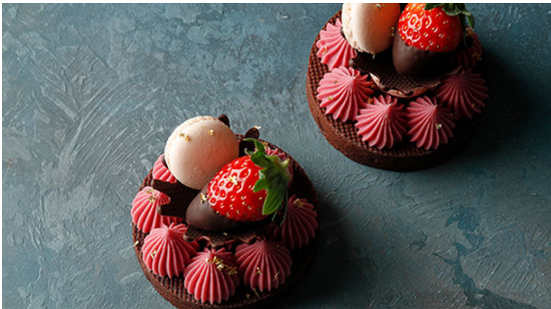
本館限定 ルビーショコラタルト

■概要 : 苺のピューレを加えたルビーショコラのガナッシュにアーモンドのキャラメリゼをアクセントに加えたタルトに仕上げました。苺とプレーンのマカロンを飾り、ルビーショコラとクラウンが遊び心を演出します。昨年よりも約1.5倍の大きさなので、ご褒美スイーツとして、またシェアしてお楽しみいただくのにもおすすめです。