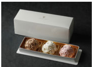
丸ビル限定 ミニマロンシャンテリーセット