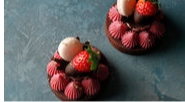
本館限定 ルビーショコラタルト