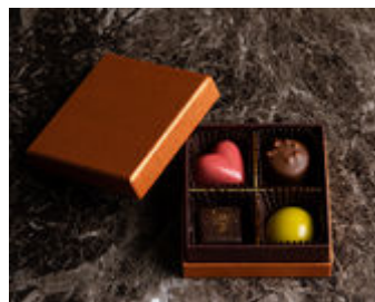
ボンボンアソルティ 4個入り