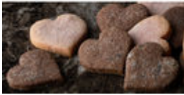
ウールーズバッグのクッキー