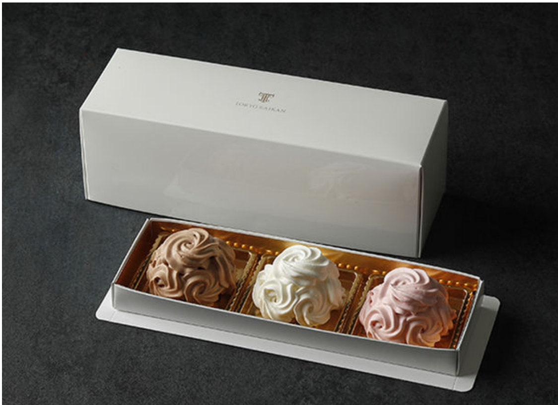
丸ビル限定 ミニマロンシャンテリーセット

■概要 : すべてローズ絞りを施した、ミニマロンシャンテリーの丸ビル限定スペシャルバージョン。2月12日の1日限りで販売いたします。フレーバーは定番の「マロンシャンテリー(中央)」、この時季だけの「マロンシャンテリー ショコラ(左)」と「マロンシャンテリー ストロベリー(右)」のセットです。