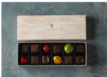
本館限定 ボンボンショコラ