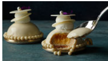
本館限定 カフェ・ラテ ムース