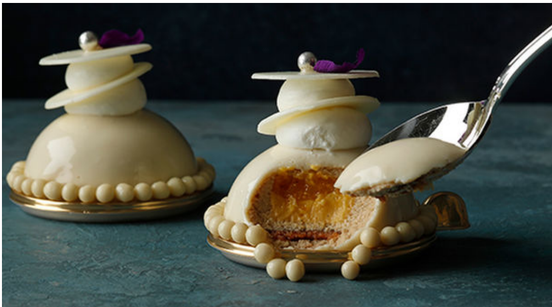
本館限定 カフェ・ラテ ムース

■概要 : 貴婦人のような風貌のエスプレッソとミルクで作ったムースの中には、マンダリンオレンジのブリュレとみかんのコンフィチュールが入って味わいを引き締めます。一口食べるとまるでカフェ・ラテのような優しい味わい。ホワイトチョコレートとミルクのグラサージュ、生クリームとホワイトチョコレートのパールクラッカンが上品な華やかさを添えます。