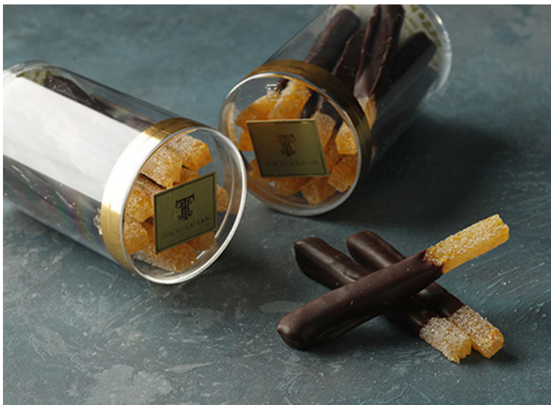
丸ビル限定 オレンジット