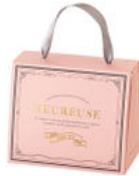
ウールーズバッグ(幸福の鞆)