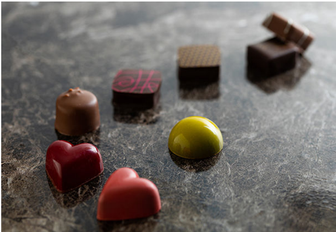
ボンボンアソルティ(イメージ)

本館取扱い商品： https://www.kaikan.co.jp/restaurant/pastryshop/menu/valentine.html