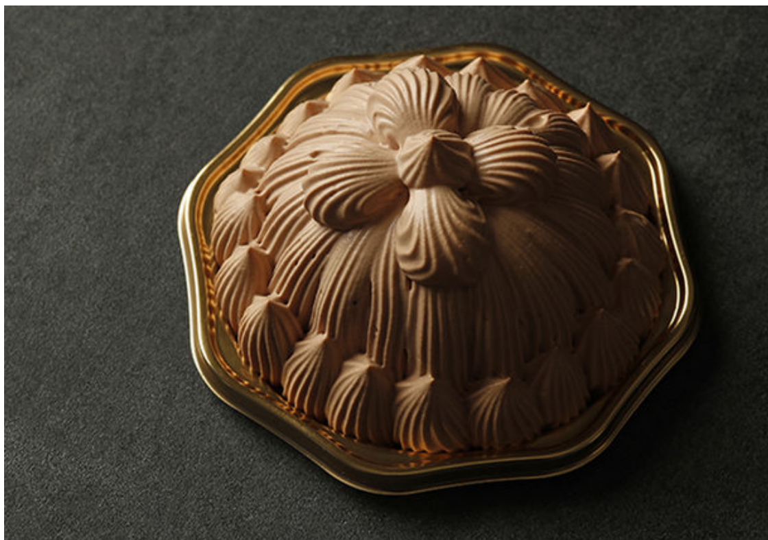
本館 マロンシャンテリーショコラ

※本館と同じくベルギー産チョコレートを使用したマロンシャンテリーショコラは大手町 L EVEL XXI 東京會館 レストラン ベラージュでも販売いたします。