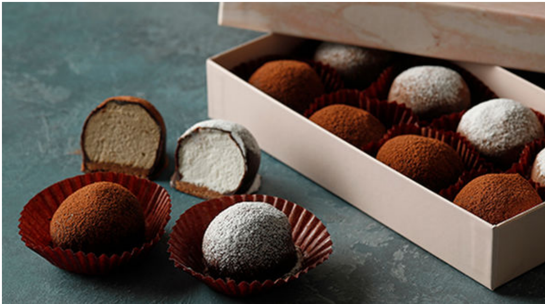
本館限定 生トリュフ