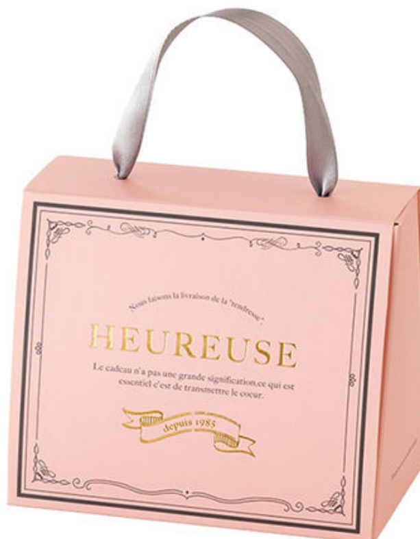
ウールーズバッグ(幸福の鞆)

■概要 : ハートモチーフとチョコレート使用のクッキー詰合せ。チョコサブレ、ミックスベリーの生地をハート型でぬいた特別なクッキーとハート型のパルミエ、アーモンドがたっぷりのアマンドショコラ、チョコレート入りのミカツキと定番の人気商品の詰合せです。