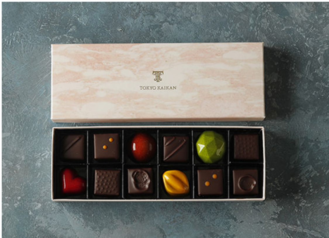
本館限定 ボンボンショコラ