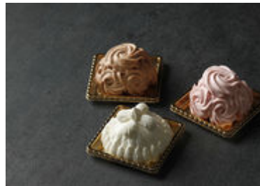
本館限定 ミニマロンシャンテリーセット