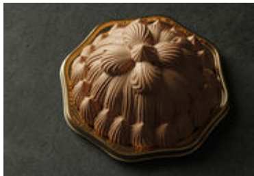
本館 マロンシャンテリーショコラ