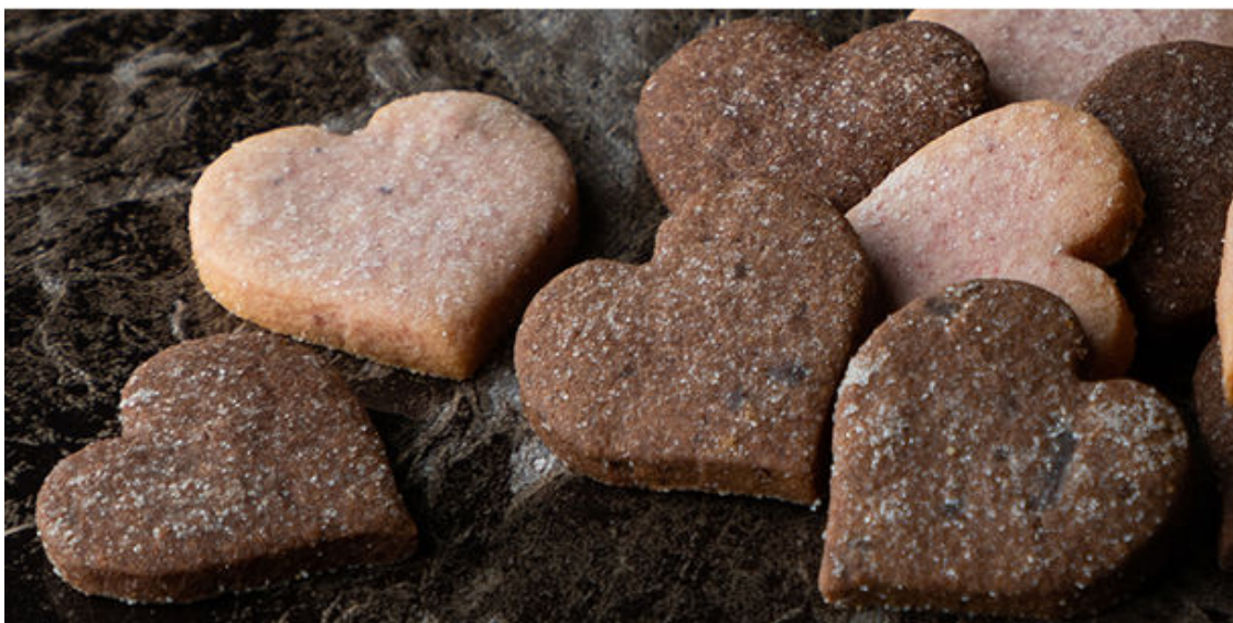
ウールズバッグのクッキー